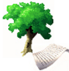
ASOCIACIÓN CULTURAL SIRUELA